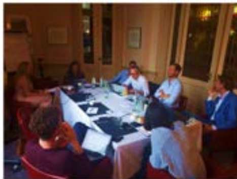
Ilustración 4. La Haya (01/06/2018)